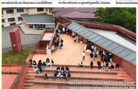
questo spazio dovrebbe servire come zona studio esterna. I hanno usata per una manifestazione elettorale

Vivere Curno e Obiettivo Curno sono benissimo che in paese c'è un nutrito elettorato che vorrebbe prenderli a botte con quegli meglio delarsi e proteggerli dietro un gazebo. Il gazebo è nostro e lo gestiamo noi. Quello che dovrebbe essere l'elettorato storico di Vivere Curno è diventato l'elettorato opportunista di quelli che cercano soluzioni a breve al minor costo possibile. Infatti "quelli che possono" i propri figli li tengono lontani dai servizi pesanti. Quelli che possono e quelli che non hanno realizzato che