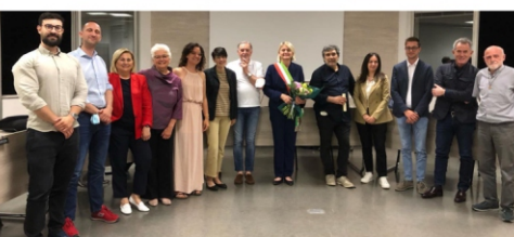
o Curno l'ultimo consiglio comunale era formato da 13 componenti.