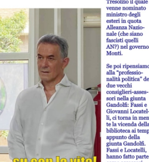
su con la vita!