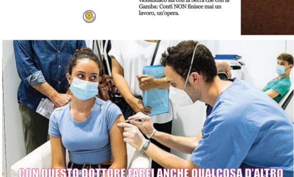
CON QUESTO DOTTORE FAREI ANCHE QUALCOSA D'ALTRO A Milano un'iniezione ieri al centro vaccinale attivo nell'hangar Bicocca