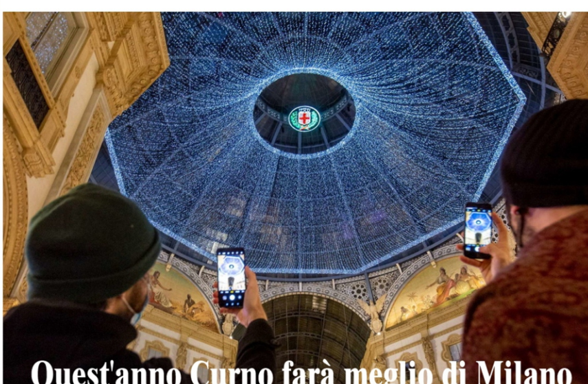
Quest'anno Curno farà meglio di Milano

Scontato che adesso con dei fitti miserrimi come quelli proposti come base, anche i due gruppi sportivi locali possono tornare in gara ed è sicuro che se li prenderanno dal momento che nessun operatore minimamente